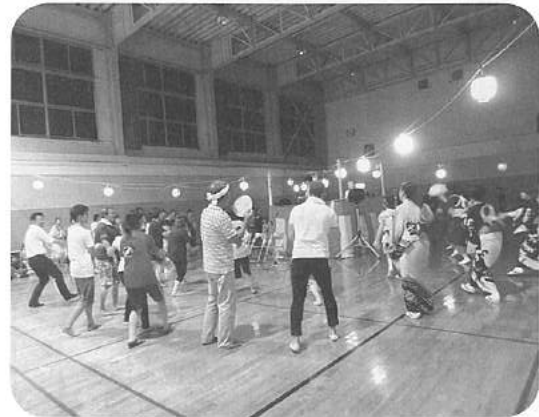
“まっかいた”で、最高潮に！

毎年恒例の荻生地区の盆踊りと納涼祭が、8月15日(水)に盛大に開催されました。今年も盆踊りの当たり年というところで、当日も怪しげな空模様のもと保育所グラウンドで会場の準備にとりかかりました。雨が降ってきたり、会場を急遽トレセンに変更せざるを得ませんでした。 このようなドタバタ劇もありましたが幸い雨も上がり、会場の内外には入りきれないくらいの人々が溢れ、県外から帰省した人と久しぶりの再会を喜び合う光景も随所に見られました。