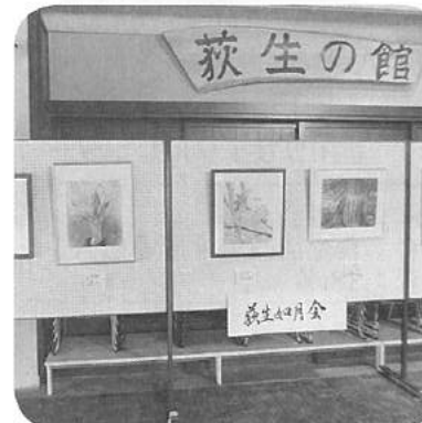
如月会の展示風景

館の多目的ホールに常時展示コーナーを設けています。 絵画・書・彫刻などの作品を展示し、地区のみなさんに楽しんでもらっては如何でしょうか。グループ・個人は問いませんので、公民館までお問い合わせください。