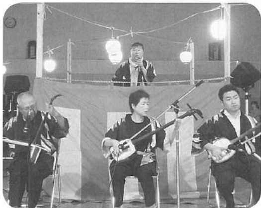
生地民謡三味線クラブのみなさん

また、今年も生地民謡三味線クラブの四名の方の生演奏のもと、8つの団体をはじめとした参加者の踊りの輪は、最後のおわら節まで大きく賑やかに続いていました。